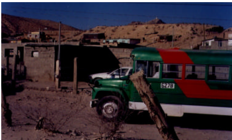
Ciudad Juárez., camión de transporte de trabajadoras de la industria maquiladora

A mediados de los años sesenta el Estado mexicano adoptó el Programa de Industrialización de la Frontera Norte, creando las condiciones necesarias para la instalación en la zona de empresas ensambladoras de productos de exportación, las llamadas maquiladoras . Desde entonces las relaciones económicas entre Estados Unidos y México se han estrechado. Las ventajas ofrecidas a las empresas para establecer fábricas en la zona ha supuesto que una gran cantidad de compañías transnacionales se instalen para aprovechar las condiciones favorables, incluyendo mano de obra barata, impuestos muy reducidos o inexistentes, el patrocinio político y sólo unas normas reguladoras mínimas.