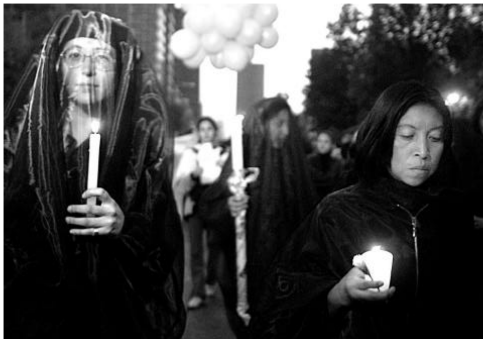
Acto de solidaridad con las mujeres desaparecidas y asesinadas de Ciudad Juárez y Chihuahua organizado por las sociedad civil.

La organización también ha criticado este poder cuasi jurisdiccional que frecuentemente está al servicio del ejecutivo, dado que las Procuradurías Generales de Justicia forman parte del ejecutivo a nivel federal y estatal. 9 Sin embargo, aunque las deficiencias estructurales de la administración de justicia son endémicas, es notorio que, en casos que conllevan un alto costo político, las autoridades han logrado investigaciones efectivas, como ocurre en algunos casos vinculados al narcotráfico.