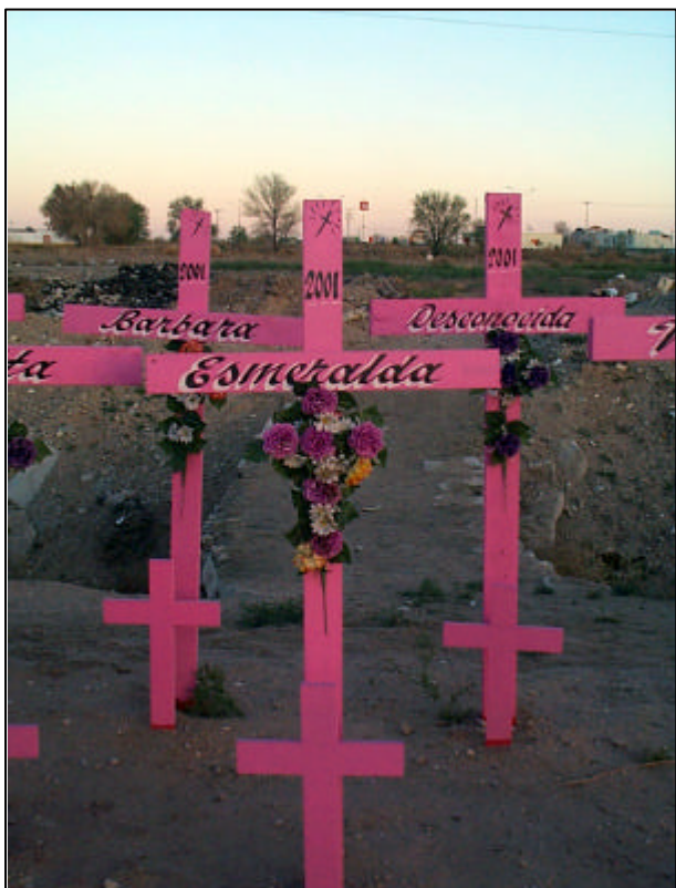
Lugar donde se recuerda a las ocho mujeres cuyos cuerpos fueron encontrados en noviembre del 2001, Ciudad Juárez.

“Dije: Ya no quiero más. Sea o no sea mi hija, yo quiero ese cuerpo”. 39