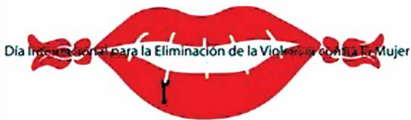
Cartel presentado al concurso de la imagen para el cartel del día internacional para la eliminación de la violencia contra las mujeres convocado por el Gobierno del Distrito Federal de México, 2006.

AUTORA JULIETA RODRÍGUEZ MEDINA CAMPAÑA NO ME AMES TANTO ORGANISMO GOBIERNO DEL DISTRITO FEDERAL DE MÉXICO | 2006